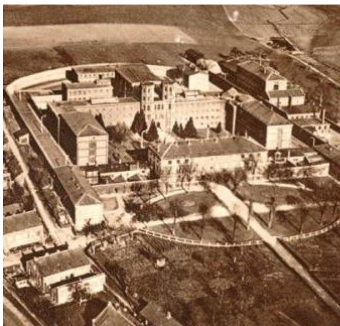
"Zuchthaus Dreierbergen-Bützow". (Fot. efter krigen).

I 1945 havde PH dette indlæg i "BAANDET" 's Aarsskrift (udgivet af Ranum Statsseminariums elevforening ved juletid). [Side 24-26].