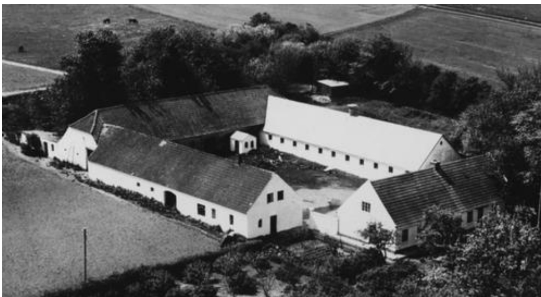
Søndergade 18, matr. 8a. Foto slutningen af 1950'erne.

11/8 1906 blev en parcel udskilt fra 8a. Den fik nummeret 8r.