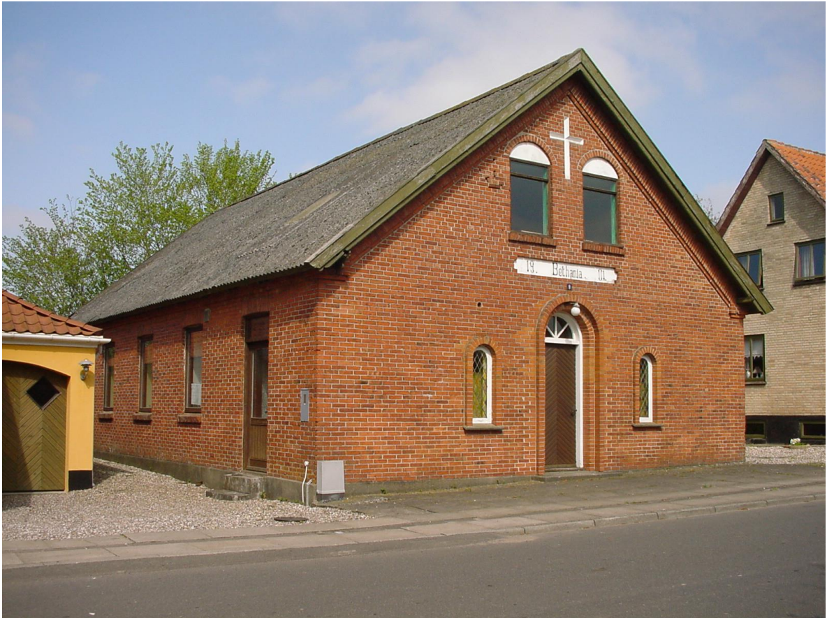
Missionshuset i 2001.