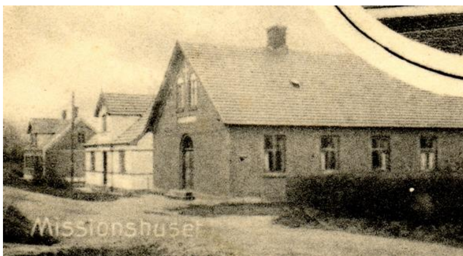
Missionshuset. Til venstre for dette nuv. Seminarievej 5 og 7 (hvidkalket). Postkort dateret julen 1912.