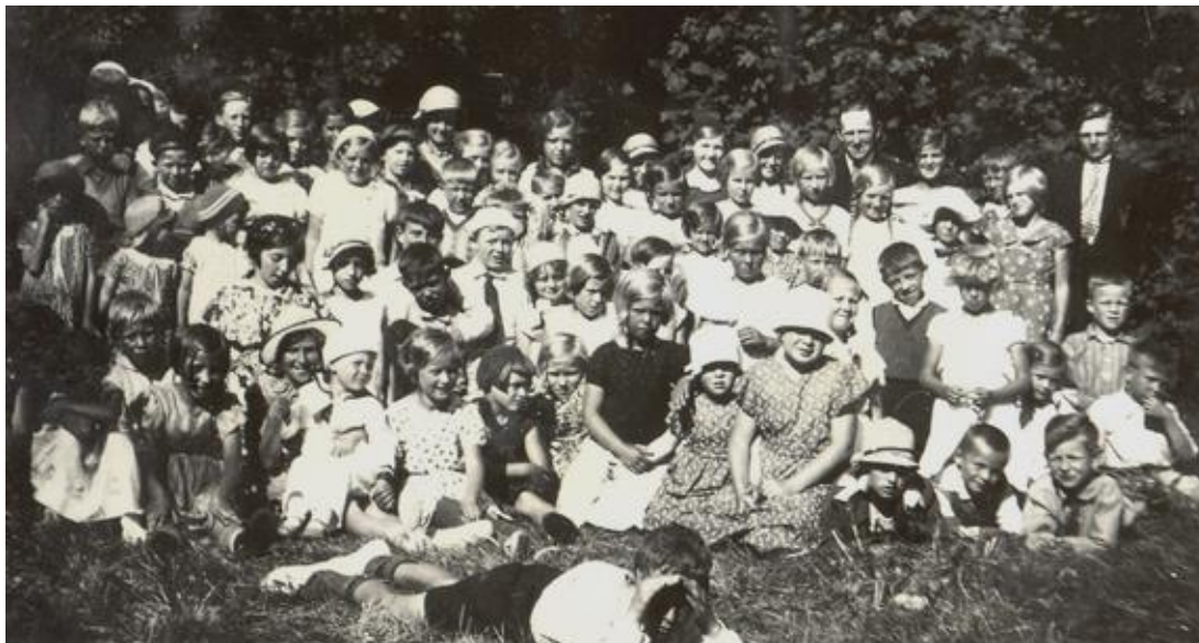
Søndagsskoleelever og deres lærere på udflugt i 1934.