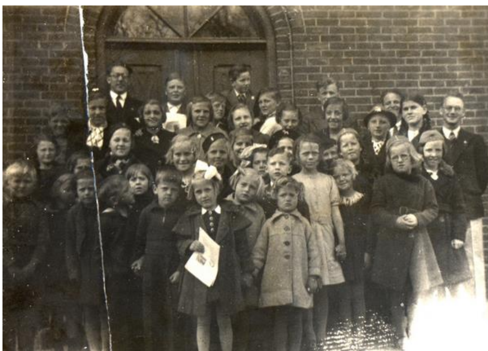
Søndagsskolens elever og lærere ved Missionshusets hoveddør ca. 1937.